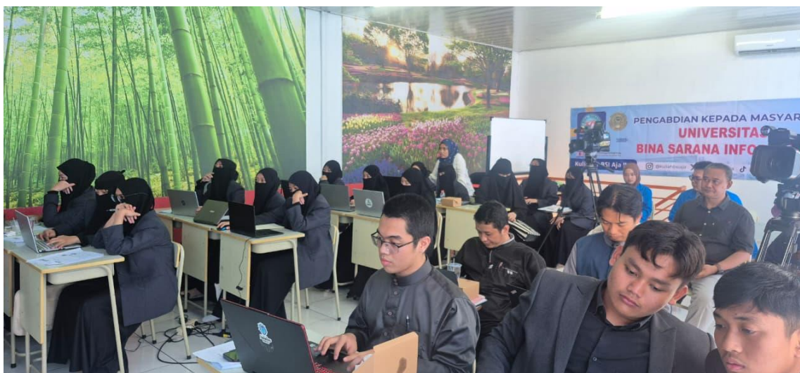
Gambar 1 pemaparan materi workshop

penting dalam adopsi teknologi baru, karena tanpa keyakinan terhadap kemampuan diri, peserta cenderung enggan menerapkan pengetahuan yang telah diperoleh.