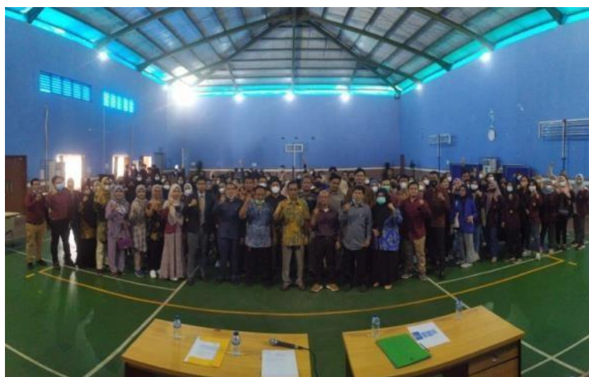
Gambar 1 pelepasan mahasiswa kampus mengajar

dilaksanakan di berbagai sekolah sasaran di Kabupaten Karawang. Setelah lapor diri, pihak Dinas Pendidikan mengadakan acara pelepasan bagi mahasiswa dan dosen pembimbing lapangan yang akan bertugas di sekolah-sasarannya masing-masing (Gambar 1). Langkah selanjutnya yang dilakukan oleh mahasiswa dan dosen pembimbing lapangan adalah melakukan koordinasi dengan sekolah sasaran SD Negeri Plawad IV sebagai bentuk lapor diri kepada pihak sekolah dan koordinasi dengan kepala sekolah serta guru terkait pembelajaran yang akan dilakukan.