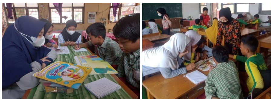
Gambar 3 melaksanakan kegiatan mengajar

Berdasarkan permasalahan tersebut, maka selanjutnya berdiskusi dengan guru dan mahasiswa/i untuk menyampaikan solusinya. Beberapa kegiatan rutin dilakukan hampir setiap hari diantaranya: (1) Pembelajaran dibuat menarik dan menyenangkan seperti adanya media pembelajaran seperti papan perkalian, soal-soal yang disajikan dengan adanya gambar. Bermain games tebak-tebakan agar siswa/i tidak merasa bosan saat sedang belajar. (2) Setelah masuk kelas membiasakan literasi selama 15 menit agar mengasah siswa/i dalam membaca. (3) Untuk siswa yang masih belum lancar membaca dan berhitung diadakan bimbingan tambahan di ruang guru saat ada waktu luang.