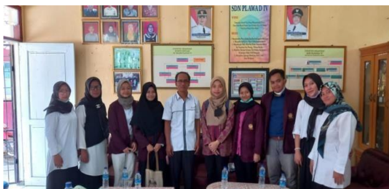
Gambar 2 kegiatan observasi

Observasi dilakukan pada tanggal 1 Agustus 2022, diawali dengan mengamati lingkungan sekolah, lingkungan sekitar dan pengamatan dalam kegiatan belajar mengajar, administrasi sekolah dan kesiapan sekolah dalam pembelajaran berbasis teknologi. Observasi ini dilakukan mahasiswa/i dan ditemani oleh dosen pembimbing lapangan dengan wawancara terhadap guru pamong dan kepala sekolah. Observasi berjalan dengan baik dan mendapatkan informasi tentang sekolah, tentang siswa/I yang belum bisa dalam membaca dan informasi tentang ketersediaan fasilitas yang ada di sekolah (Gambar 2). Dari hasil observasi diketahui bahwa di SD Negeri Plawad IV memiliki bangunan yang terdiri dari 6 ruang kelas, 1 ruang guru dan kepala sekolah dalam satu ruangan.