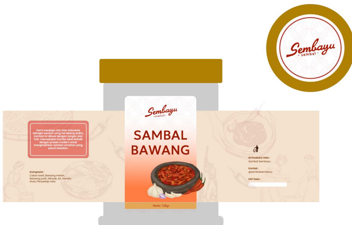
Gambar 2 desain kemasan untuk sambal Sembayu

Mengacu pada Letona et al. (2014), elemen visual yang menarik dapat meningkatkan perhatian lintas kelompok usia. Desain kemasan sambal Sembayu dirancang dengan pendekatan visual yang relatif netral namun tetap menggugah selera (Gambar 2), sehingga dapat menjangkau konsumen dewasa sebagai target utama tanpa mengabaikan daya tarik bagi segmen usia lainnya. Penggunaan warna yang bersih dan kontras moderat membantu menciptakan kesan profesional dan terpercaya.