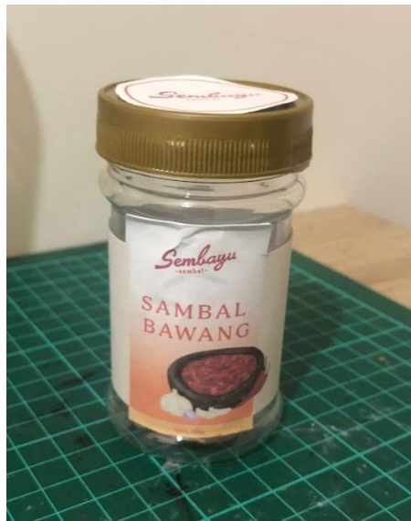
Gambar 1 mock up/dummy sambal Sembayu

kembali kepada pemilik UMKM untuk memastikan kesesuaian dengan kebutuhan dan identitas merek sebelum diimplementasikan pada produk akhir.