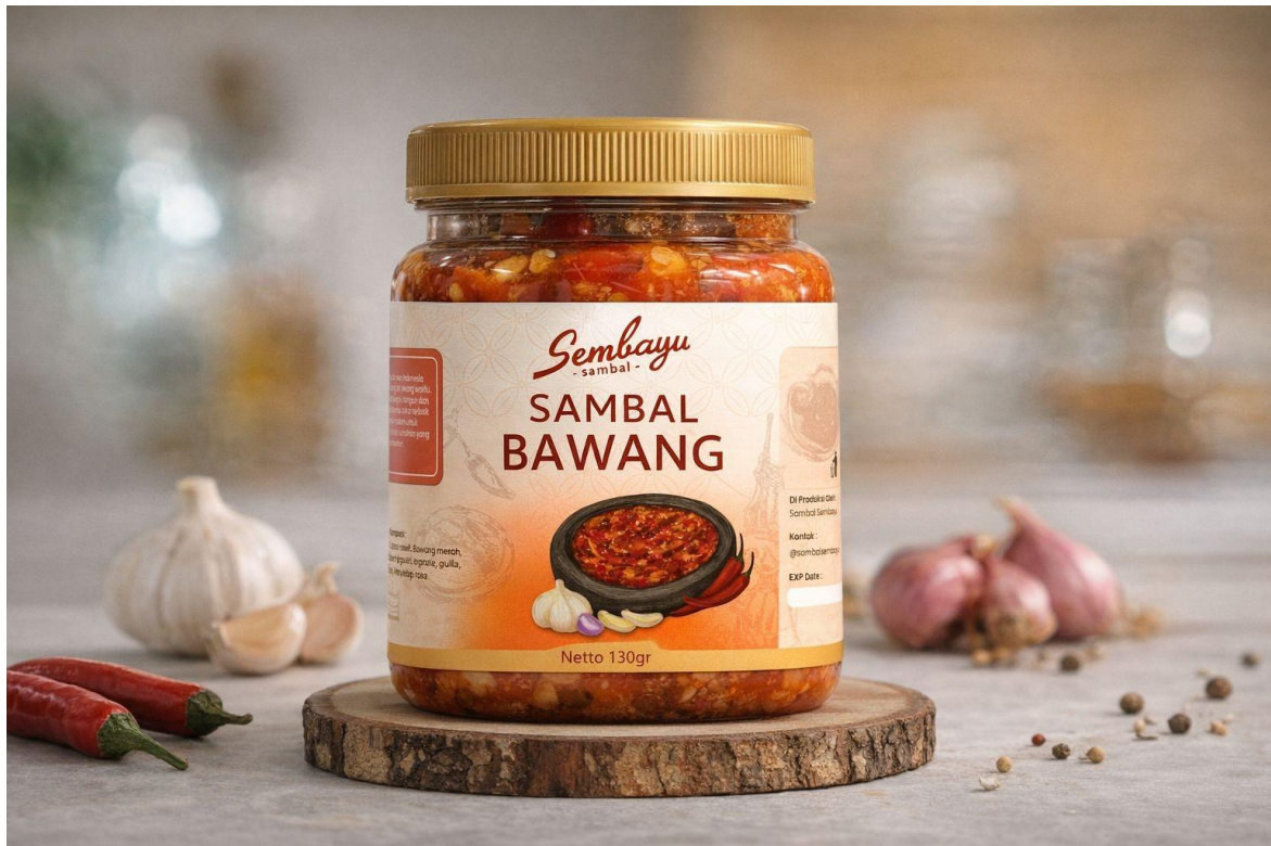
Gambar 3 implementasi desain kemasan untuk sambal Sembayu

UMKM. Pemilik UMKM memberikan tanggapan positif terhadap desain kemasan baru karena dinilai lebih representatif terhadap identitas merek dan berpotensi meningkatkan daya tarik produk di pasar. Secara keseluruhan, hasil perancangan kemasan ini menunjukkan bahwa integrasi studi literatur, prinsip desain komunikasi visual, dan pendekatan desain partisipatif mampu menghasilkan kemasan yang lebih komunikatif, estetis, dan sesuai dengan kebutuhan UMKM Sambal Sembayu.