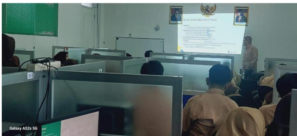
Gambar 1 pelatihan siswa siswi SMK Ma'arif Jakarta

Kegiatan workshop Microsoft Excel 2013 yang dilaksanakan selama dua hari di Laboratorium Komputer SMK Ma'arif Jakarta berjalan dengan lancar dan sesuai dengan tahapan metode yang telah dirancang. Program ini diikuti oleh 80 siswa kelas XI dan XII yang menunjukkan tingkat partisipasi tinggi sejak awal hingga akhir kegiatan (Gambar 1 dan 2). Berdasarkan hasil pre-test yang dilakukan pada tahap awal, diketahui bahwa sebagian besar peserta masih memiliki pemahaman yang terbatas dalam penggunaan Microsoft Excel, khususnya dalam penerapan rumus dan pengolahan data secara sistematis.