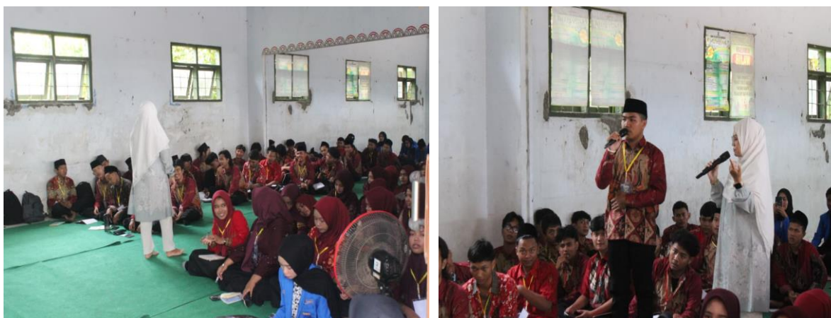
Gambar 1 pelaksanaan kegiatan

Pelaksanaan kegiatan pengabdian pada 30 September 2025 berlangsung secara luring dengan suasana yang kondusif dan penuh semangat. Mahasiswa yang hadir, yang merupakan aktivis organisasi ekstra kampus dari berbagai angkatan dan fakultas (Gambar 1). Hal ini menunjukkan keterlibatan yang tinggi sejak sesi pembukaan hingga penutupan. Kehadiran mereka yang mencerminkan adanya rasa haus akan ruang dialog yang aman dan terarah untuk membahas isu-isu karakter yang selama ini jarang disentuh secara terbuka. Interaksi yang tercipta antara peserta dengan narasumber yang juga merupakan alumni organisasi ekstra kampus, menciptakan iklim saling percaya yang memungkinkan pembahasan mendalam terjadi dalam waktu yang relatif singkat.